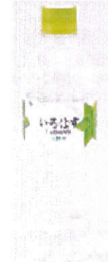
商品名 ⑥コカ・コーラ いろ・は・す 555ml 価格(税込) 108円