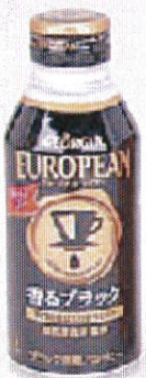
商品名 ⑦ジョージア ヨーロピアン 香るブラック 400ml 価格(税込) 151円