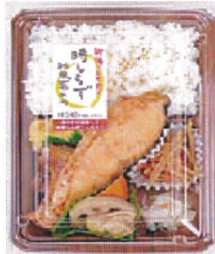
商品名 ④新潟コシヒカリ 時しらず和風幕の内弁当 価格(税込) 590円