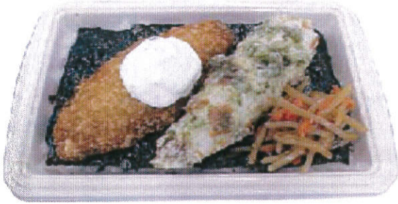
商品名 ①白身フライのり弁当 価格(税込) 360円